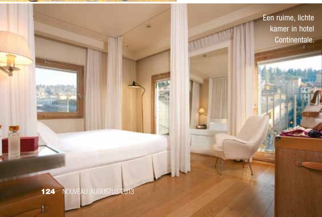
Een ruime, lichte kamer in hotel Continentale.

Informatie www.highfashiontravel.nl , helen@highfashiontravel.nl of 088-530 53 61.