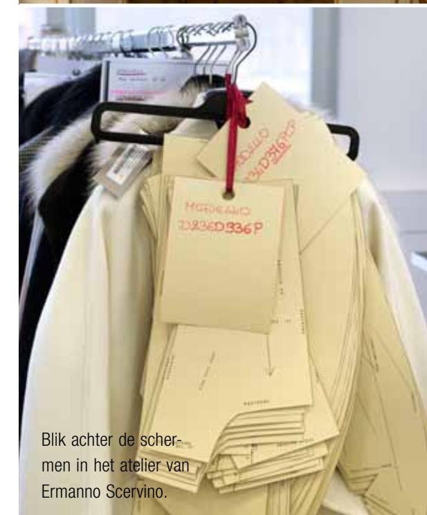
Blik achter de schermen in het atelier van Ermanno Scervino.